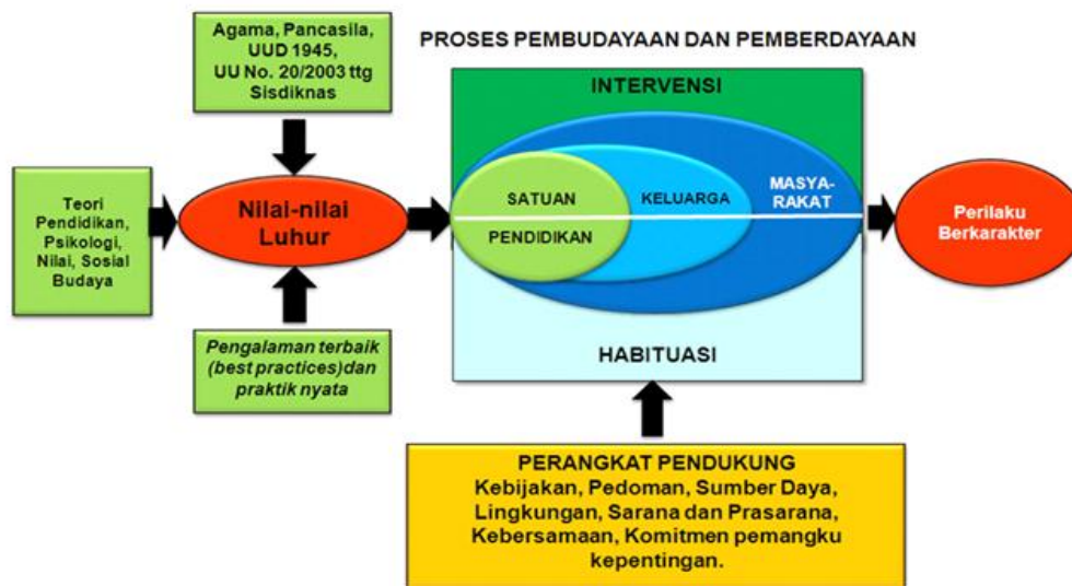
Gambar 2. Grand Design Pendidikan Karakter 18

masyarakat. Grand design pendidikan karakter yang melibatkan seluruh komponen dapat dilihat dalam gambar di bawah ini: