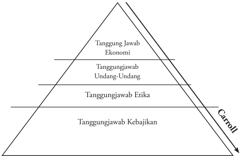
Gambar2: Piramid CSR Menurut Carroll

Tanggungjawab sosial menurut Carroll (1999) dibentuk seperti piramida, dimana tanggungjawab ekonomi merupakan tanggungjawab utama kepada perusahaan, diikuti dengan tanggungjawab terhadap undang-undang, etika dan terakhir adalah tanggung jawab kebajikan (Carroll, 1999: 264). CSR menurut Carroll dapat digambarkan seperti rajah2 berikut ini: