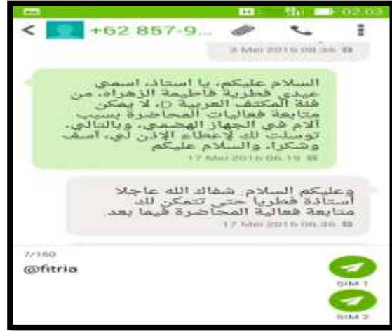
تسيط الطالبة (إلى حد ما) على المفردات العربية وتوظيفها في جمل وتصممها في مختلف الأساليب مع مراعاة العناصر المذكورة