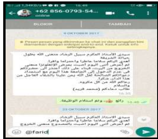
يحاول هذا الطالب أن يكتب نفس القضية بمختلف الجمل والأساليب فإذاً أصبح ذلك المثير البسيط فعالاً إلى حد ما في إعداد البيئة اللغوية ولكن رغم ذلك على المدرس أن يتابع أمور التلاميذ

وما أدنى هذه السطور نماذج متابعة المدرس للطلاب سواء داخل مهمتهم التعليمية أم غيرها. وقد تعدّ أن قدرة الطلاب في هذا الدور تنطلق من الإثارة حول الاعتذار السابق عبر وسائل التواصل الاجتماعية، فكلما تزداد المثيرات شيمة فتزداد الاستجابات جودة، ولذا قد اتسعت وارتقت خزائن