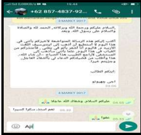
نموذج يستحق الدعم بطرف المدرس إذ يخطئ بعض المصطلحات مثل انتسيف والأريية بجانب أنها تتمتع بالجودة أكثر

وستوضح النماذج التالية بعض اختراعات الطلاب عند اختيار المفردات وتوظيفها في مختلف الجمل والأساليب مع مراعاة العناصر التي وضعناها في مقدمة الفصل.