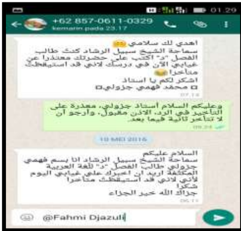
تتمتع بدرجة أكثر من روعة وتستوفي العناصر المطلوبة مراعيًا في ذلك قواعد اللغة العربية، وهذا نموذج بسيط عندما يطبق المدرس هذه الإثارة في مجموعة الفصل أ