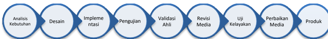
Gambar 1. Tahapan metode R&D

Metode penelitian yang penulis gunakan dalam membuat game edukatif dakwah ini adalah metode riset dan pengembangan atau biasa dikenal dengan metode research and development (R&D). Metode R&D penulis pandang cocok untuk digunakan, karena sejalan dengan proses pembuatan produk game edukatif dakwah ini. Selain itu, R&D dapat menginterpretasikan keefektifan produk game yang telah penulis buat, baik dari sisi materi dan dari sisi media gamenya (Ghea, 2012). Tahapan Metode R&D ditunjukkan dalam Gambar 1.