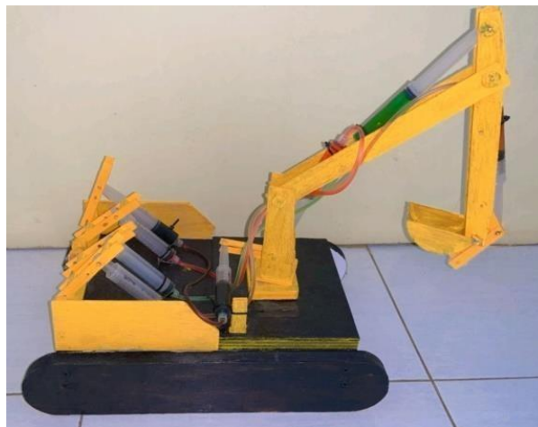
Gambar 1. Bentuk Alat Peraga Sistem Pompa Hidrolik Sederhna