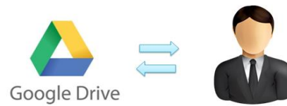
Gambar 1. Manfaat google drive dengan user

Pemanfaatan layanan berbasis online ini merambah hingga ke berbagai bidang, termasuk dalam dunia pendidikan. Layanan ini diharapkan dapat memacu tenaga pengajar untuk lebih kreatif dan terpacu dalam mempelajari bermacam perubahan terbaru dari teknologi informasi.