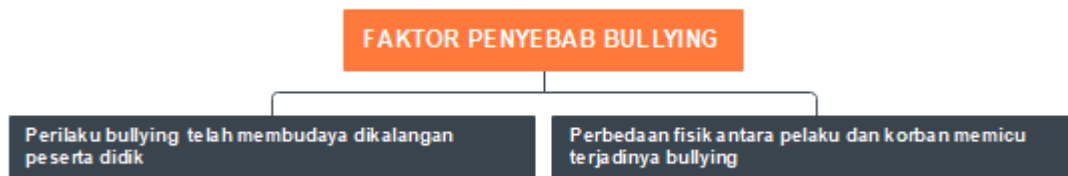
Gambar 1. Faktor penyebab perilaku bullying

Informasi ini disampaikan oleh para informan dengan bahasa yang sedikit berbeda, namun memiliki makna yang sama maka didapatkanlah hasilnya sebagai berikut: