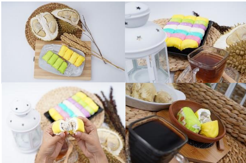
Gambar. 4 Hasil Foto Produk UMKM Madhuri Pancake

Peserta juga dibekali foto produk. Dengan tujuan produk yang sudah ada saat ini tidak lagi di foto secara sembarangan. Akan tetapi sebaiknya dilakukan dengan konsep yang lebih serius. Berikut ini adalah beberapa hasil foto produk dari UMKM Madhuri Pancake.