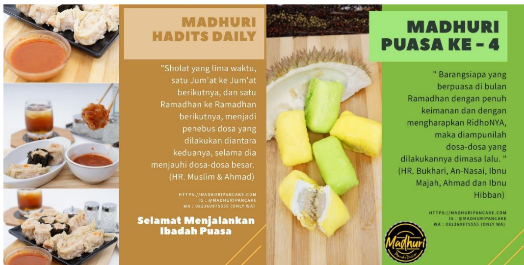
Gambar 6. Konten Dakwah Madhuri Pancake

Pada gambar di atas dapat dilihat bahwa ada konten pilar tentang hadist yang di dalamnya adalah mengambil hadist-hadist tertentu kemudian dibuatkan dalam bentuk flyer . Flyer ini kemudian dibagikan melalui Instagram. Konten ini dibuat secara khusus dan kontinu agar dapat dilihat oleh masyarakat. Salah satunya ada 1000 lebih orang yang akan melihat konten ini.