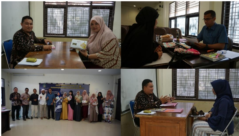
Gambar 2. Identifikasi permasalahan UMKM

Selanjutnya dilakukan pendampingan terhadap UMKM Madhuri Pancake untuk memahami konsep marketing lebih modern. Pendampingan diawali dengan mengidentifikasi permasalahan awal dari produk.