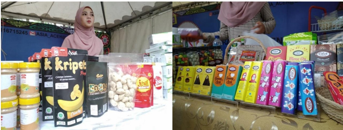
Gambar 1. Produk UMKM di Bazar (kegiatan sebelum Covid 19)

Hasil identifikasi dan observasi di lapangan ada banyak sekali produk UMKM lokal di Banda Aceh yang sudah menarik kemasannya. Produk telah memiliki merek, logo, kemasan, dan pilhan warna yang cukup menarik. Standar kemasan juga sudah sangat baik, sehingga produknya bisa bertahan lebih lama. Berikut ini contoh beberapa UMKM di Banda Aceh yang sudah menarik kemasannya.