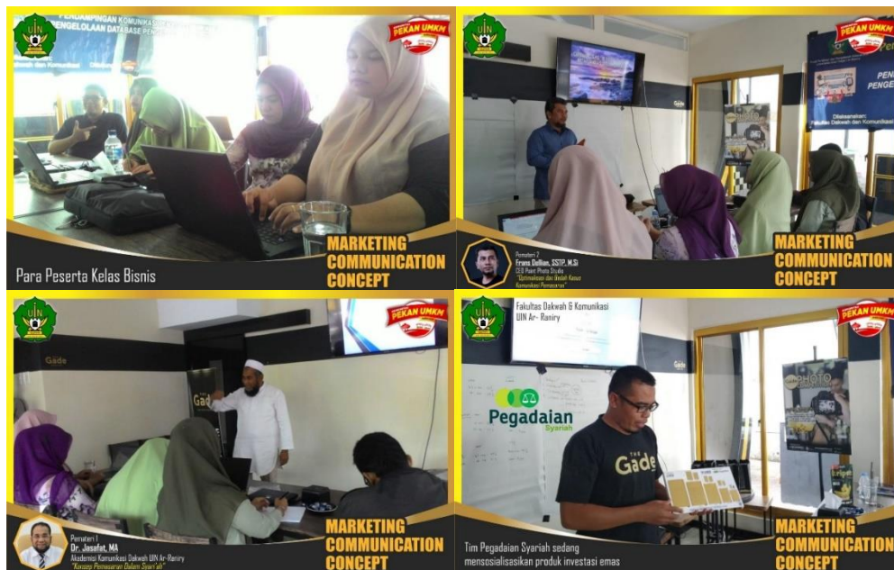
Gambar 3. Pendampingan peserta

Pada tahapan ini peserta diberikan pembekalan pembelajaran tentang bagaimana membuat promosi produk yang baik. Materi disampaikan oleh pemateri secara profesional dengan bidang masing-masing. Bidang pertama yang dibahas adalah pemanfaatan sosial media sebagai media promosi. Materi kedua tentang bagaimana teknik foto produk yang baik. Materi yang ketiga tentang bagaimana membuat konten dakwah dalam promosi produk. Serta membuat konten pilar tersendiri sebagai media dakwah.