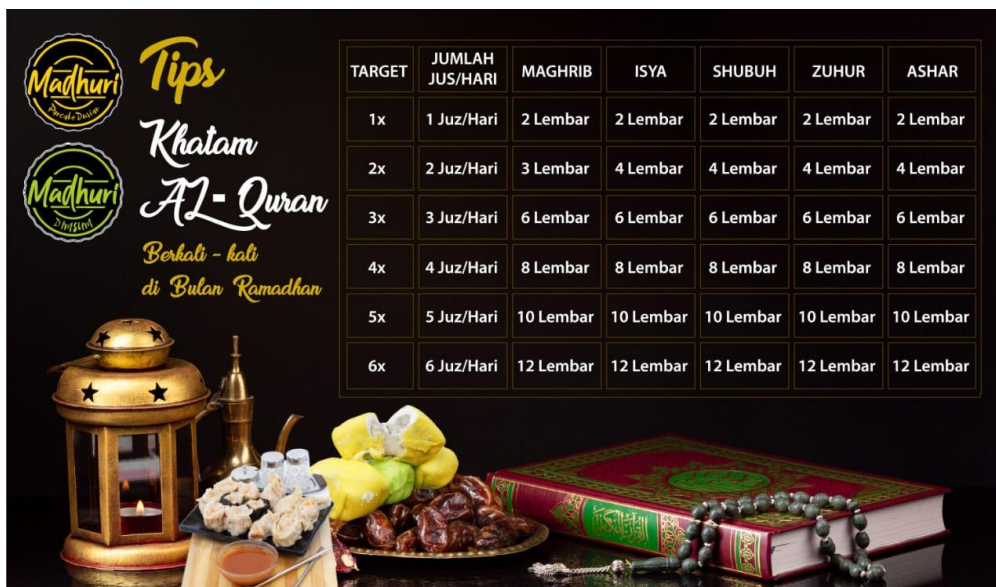
Gambar 7. Tips Khatam Alquran

Seperti gambar di atas membagikan cara dalam mengkhatam Alquran. Misalnya ada berkeinginan dalam mengkhatam berapa kali Alquran. cara ini sangat berguna jika memang benar-benar diterapkan di dalam Bulan Suci Ramadhan. Ini akan menjadi komunikasi dakwah yang sangat bermanfaat kepada umat. Selain melaksanakan promosi namun juga memberikan unsur dakwah secara sengaja oleh pelaku usaha.