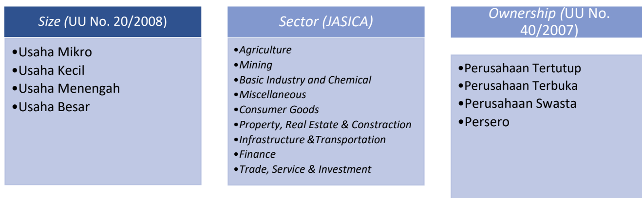
Bagan 1. Klasifikasi Pelaku Usaha 18

Klasifikasi struktur bisnis tidak disertakan dalam bagan di atas karena Indonesia sendiri belum mengatur secara spesifik berkaitan dengan structure yang dimaksud dalam Panduan Interpretasi UNGPs. Struktur bisnis yang dimaksud dalam UNGPs yaitu apakah perusahaan termasuk perusahaan grup ( holding company ) atau bukan, kemudian perusahaan tersebut sebagai induk perusahaan ( parent company ) atau anak perusahaan ( subsidiary ). 19 Status perusahaan dalam struktur bisnis sangatlah penting sebagai tolak ukur bagaimana penanganan HAM yang harus dijalankan. Meskipun tidak ada pengaturan khusus tentang holding company , namun pada prakteknya holding company itu ada di Indonesia dan beberapa peraturan perundang-undangan melegitimasi adanya induk dan anak perseroan seperti yang diatur dalam Pasal 84 ayat (2) UU No. 40 tahun 2007 dan PP No. 72 Tahun 2016.